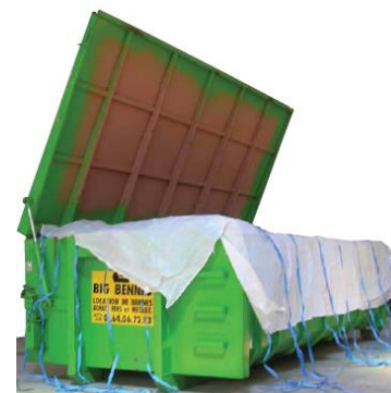
Body benne 15m 3

Si vous n'avez pas la main d'œuvre pour cette opération, nous pouvons vous mettre à disposition du personnel formé et habilité pour le conditionnement de déchets amiantés, vous permettant alors d'être en règle avec la législation pour le transport.