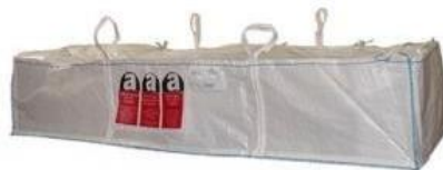
Dépôt bag (plusieurs tailles)