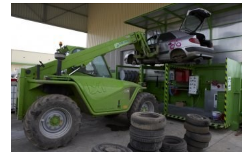
Station de dépollution VHU