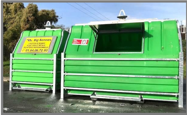
Les Air Box : 1,5 m 3